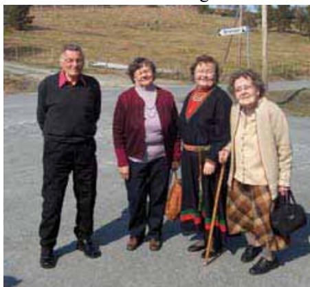
Her er noen fra Elgå og Singsås på vei til vårtreffet.

Tida gikk veldig fort, og etter en stund så vi at vi måtte sende kokkene våre av sted for å lage kveldsmat.