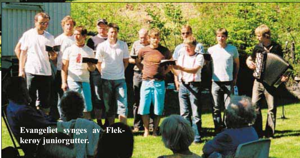
Evangeliet synges av Flekkerøy juniorgutter.