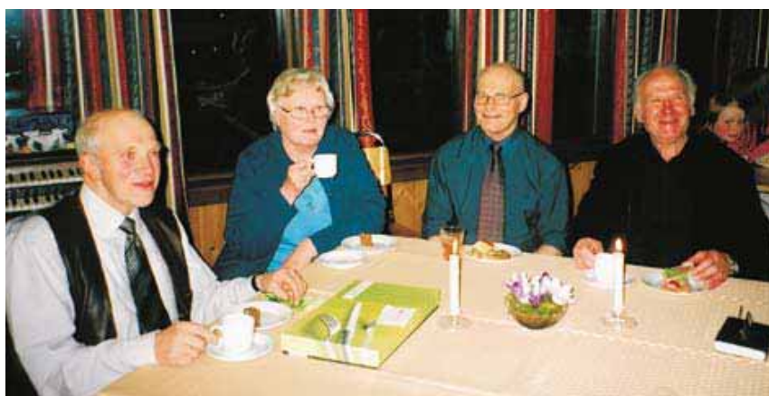
Bortsett fra russerne var disse blant de som hadde lengst reisevei. De kom fra Rennebu. Men hjem skulle de samme kveld, for dagen etter var det nemlig Kolafest i Rennebu med fullt bedehus og stormende jubel.

de vi faktisk regnet med mer folk fra bygda, men vi ble da 80-90 stykker