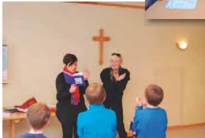
Sang med bevegelse: "Hvem har skapt alle blomstene?"