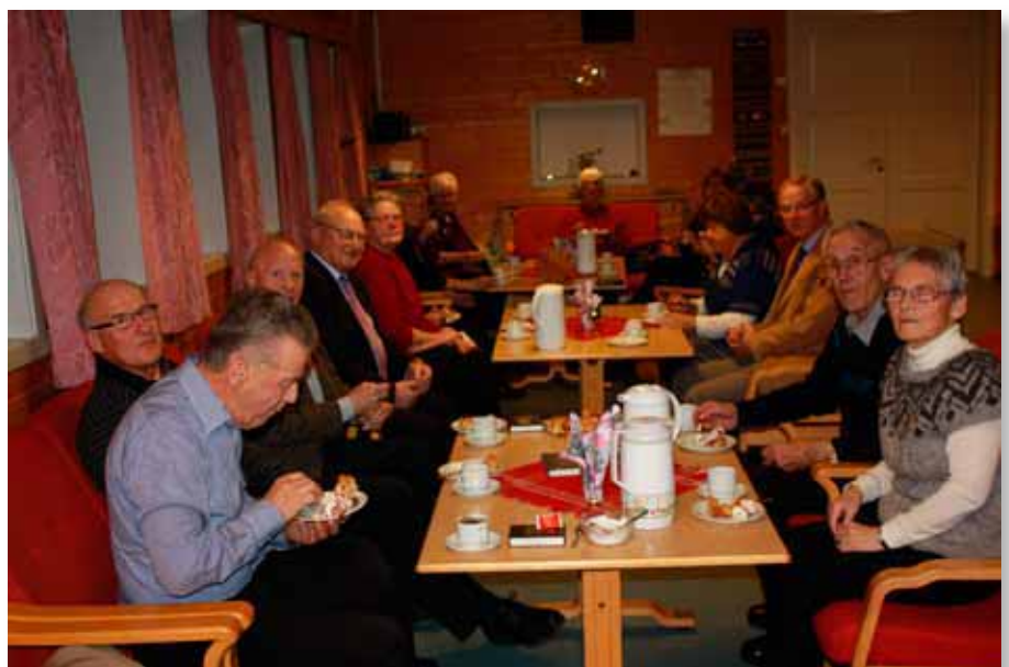
Kaffi høyrer til på misjonsmøte i Hafslo.

Og på denne vegen mellom Fortun og Hafslo ligg Luster. Her får eg sjå innoen ein familie der far har røter frå grannebygda mi. Eg får enno ein gong vere på vitjing hos Straumstein sine. Og fornye kjennskapet med små og store. Og får velsigning med