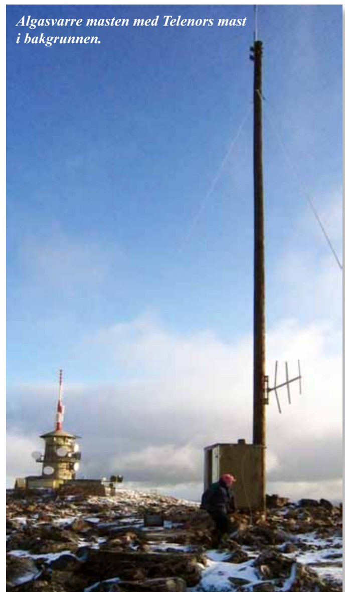
Algasvarre masten med Telenors mast i bakgrunnen.

På forhånd sier vi hjertelig takk for all støtte!