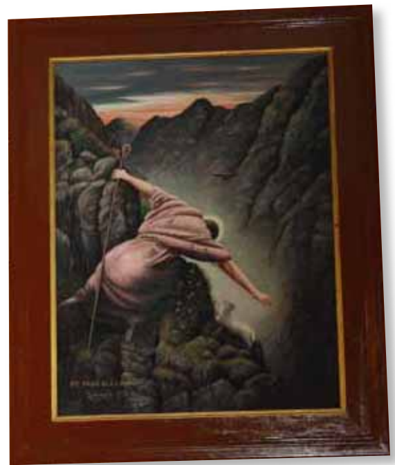
Motivet er velkjent.

Innerst inne i ein av fjordarmane i Sognefjorden ligg Skjolden, og berre eit par kilometer opp gjennom dalen derfrå ligg ei bygd som heiter Fortun. Kjellaretasjen i Bedehuset der hadde blitt skada av vatn, men møtesalen var intakt. Store og små møtte fram, og i det minste eg som var gjest, fekk velsigning med på vegen vidare. Eg vonar og bed om at dei som var på møtet også fekk noko med på heimvegen.