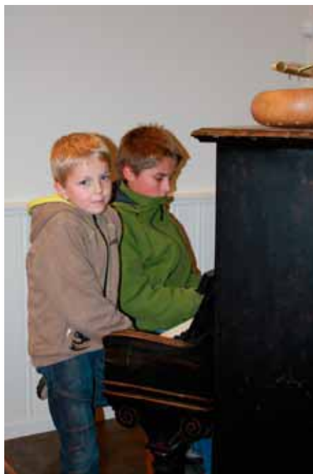
Unge i Luster står klare til å overta musikken.

Vel mottatt vart eg denne gongen også hos vertskapet. Dei stelte godt